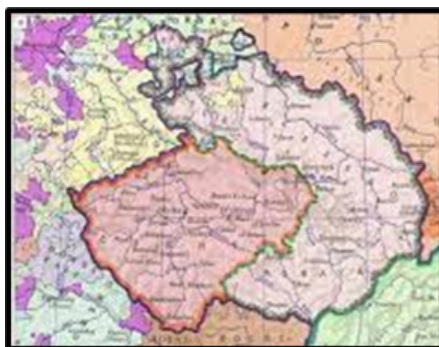
České země v době husitských válek

Reinterpretace historie je příznačná pro každou dobu; historii píše vítěz, ale jaký je pohled poraženého? Vzpomeňme ruského autora Kirilla Eskova (Кирилл Юрьевич Есков), který proměnil všeobecně známý příběh Tolkienovy trilogie Pán prstenů v nové dílo ( Poslední pán prstenu ), kdy černokněžník Sauron je nahlížen jako postava pozitivní. Vidíme, že historie je narativem, který může být v určitých dějinných momentech zneužit. Ze známých osobností se stává symbol, ikona, která s reálným osudem člověka již nemá mnoho společného. Navzdory dostupným pramenům dochází k fabulaci.